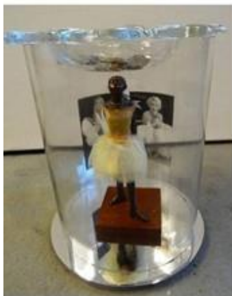
- Gender, - Ideaal, - Cabinet Secret