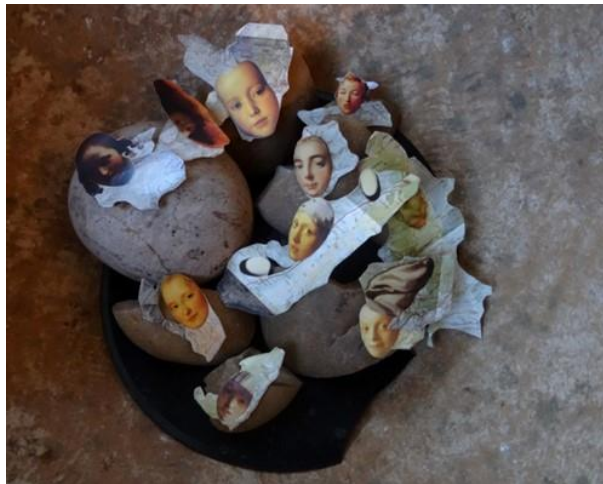
Assemblages over 'Naakt of Bloot' 2019-2020 De stolpen representeren de limiet van de manifestaties.