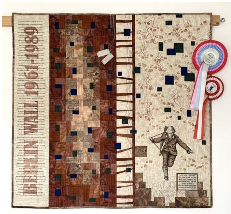
'A leap to freedom'

Met deze quilt won Esther in 2013 de eerste prijs op de Open Europese Quiltkampioenschappen.