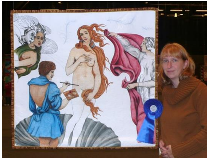
'Birth of Venus'