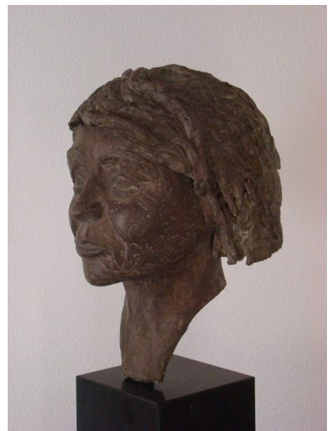
Who is this lady?

Tijdens saaie vergaderingen teken ik heel veel droedels. Deze doedels groeien dan vaak uit tot een idee.