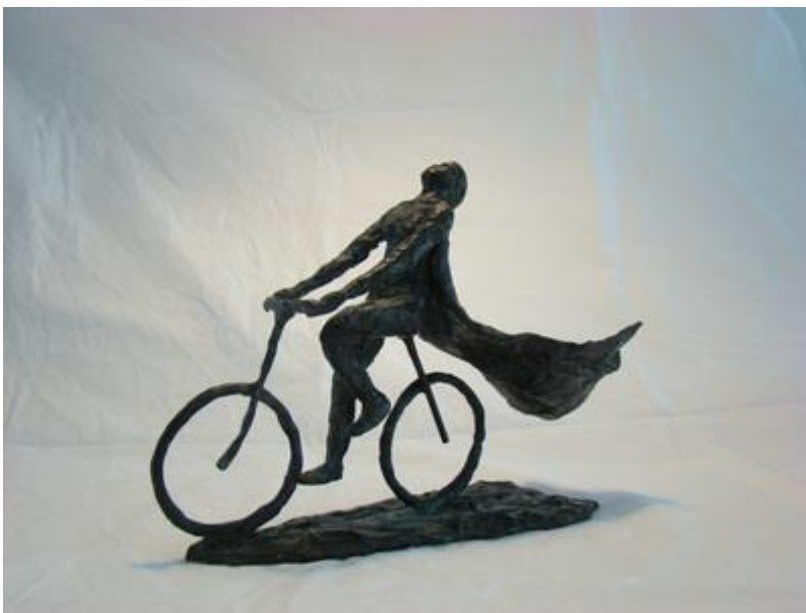
De laatste zet